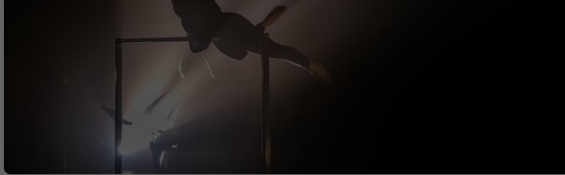
Le spectacle Un contre un sera donné au Théâtre de Cornouaille dans le cadre du festival Théâtre à tout âge jeudi 16 et vendredi 17 décembre 2021.